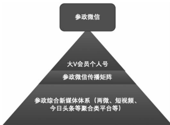
图1 民主党派三级传播矩阵体系

随着自媒体、短视频等新媒体平台的兴起,人们的阅读习惯与关注焦点发生了巨大变化,短视频已成为当下颇具传播力的信息载体。2019年8月26日,中国民主促进会官方微信公众号宣布正式入驻今日头条——“民进网”头条号正式上线,同时“民进网”企鹅号也即将开通,这些都标志着民主党派在新媒体平台宣传路径将更加多元化。建立民主党派联动宣传三级传播矩阵(如图1),构建复合型参政新媒体平台,探索民主党派新媒体宣传新窗口刻不容缓。